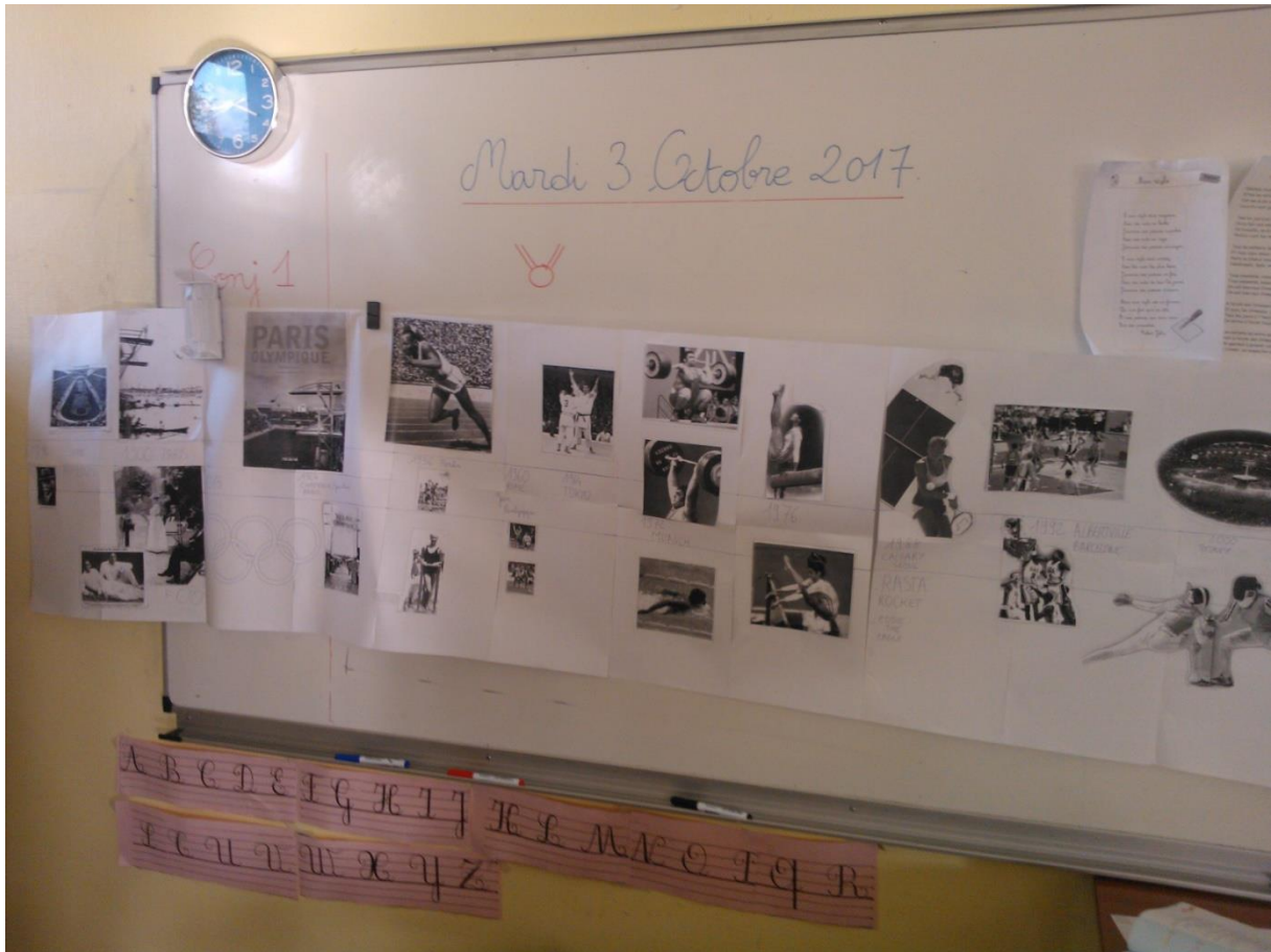
La frise chronologique reconstituée.