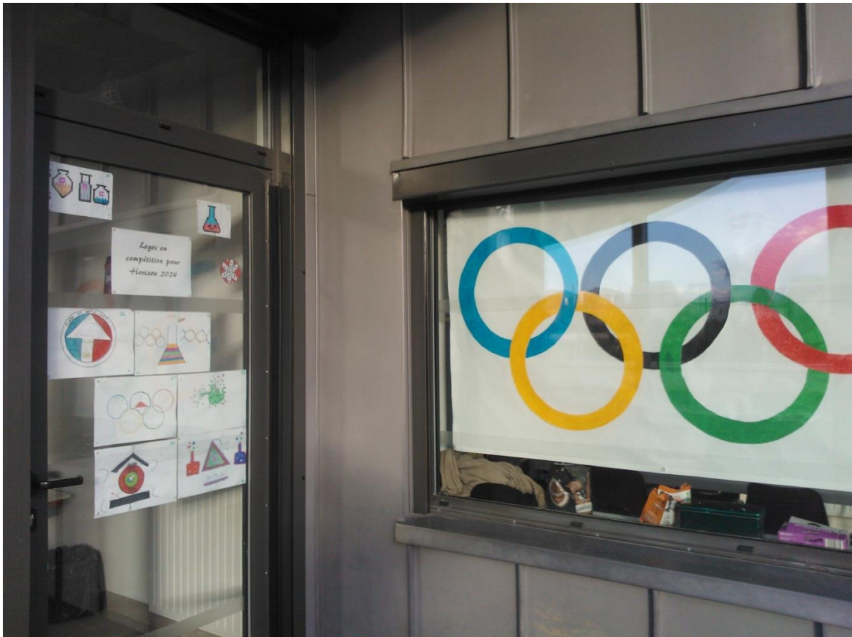
décoration de l'école Marie Curie de Montereau (réalisée par les élèves).