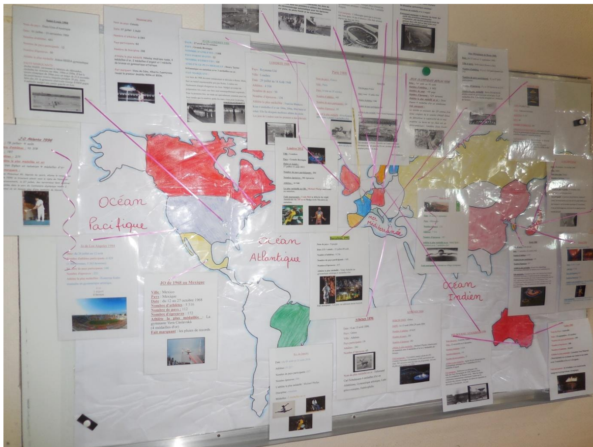
Panneau de l'exposition présentée aux parents.