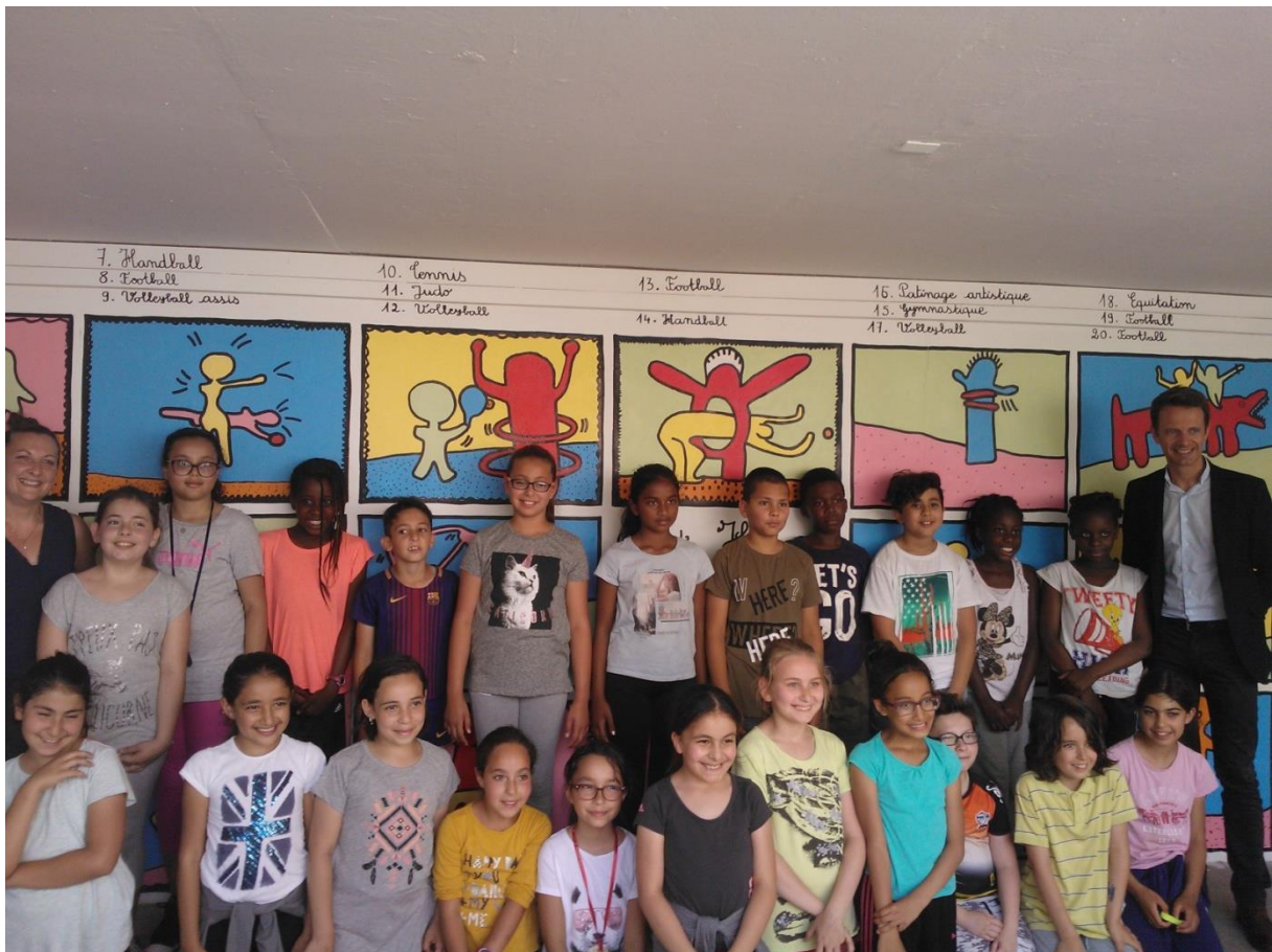
la frise qui décore l'école.